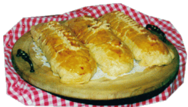
Schweinefilet in Blätterteig