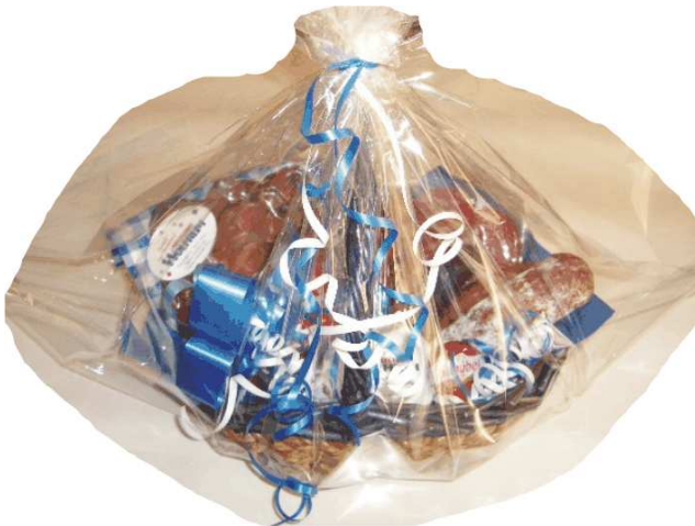
Präsent- u. Geschenkkörbe