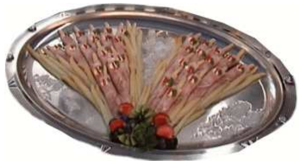
Schinkenröllchen mit Spargel