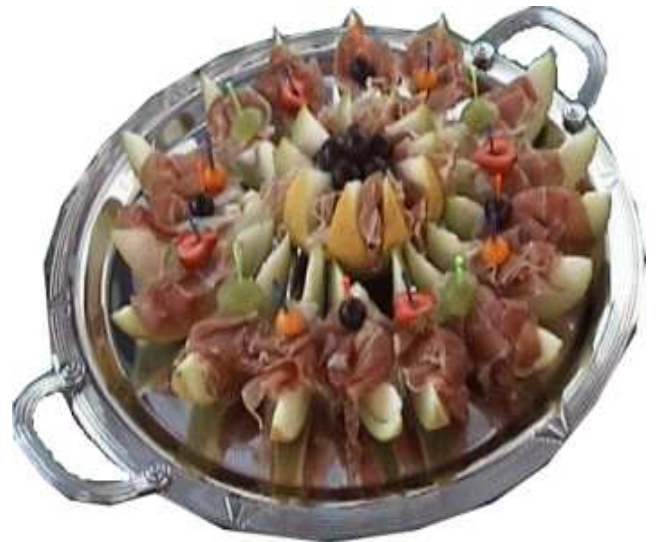
Melonenschiffchen mit Parmaschinken