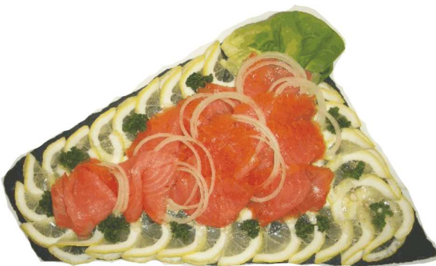
Platte mit echten Räucherlachs