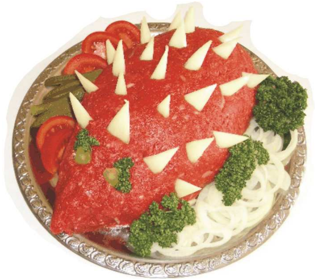
„Igel“ aus Tatar